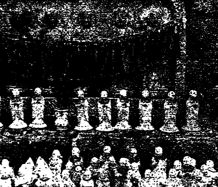
الاحتفال بذكرى ثورة تشرين

واضحت تقول: الأردن يقوم بجزء كبير في هذه الاتصالات نظرا لضعف الحركة السياسية الأردنية، وأن نتائج هذه الاتصالات وخاصة السياسي الأردنية التي تظل بتوجيه من المعامل الأردني سوف تظهر نتائجها تريبا. القاهرة - ر